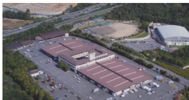
公設地方卸売市場の上空写真

長きに渡り民営化が検討されてきた大津市公設地方卸売市場。過去の天津市の見通しの甘さと、入場業者との協議が十分でなかったことにより、民営化は見直しとなり、当面の間は公設公営が維持される事となりました。